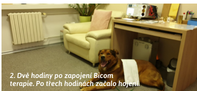
2. Dvě hodiny po zapojení Bicom terapie. Po třech hodinách začalo hojení