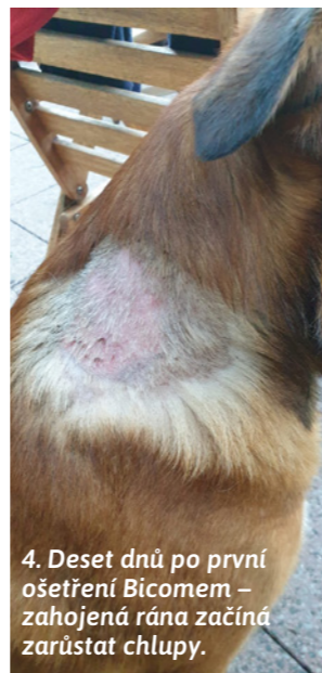
4. Deset dnů po první ošetření Bicomem – zahojená rána začíná zarůstat chlupy.