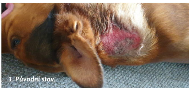
1. Původní stav

Novinkou v Bicom terapii je i frekvenční ampulka na snížení vlivu 5G záření, jejíž frekvence se dají nahrát do čipu společně s klasickou terapií.